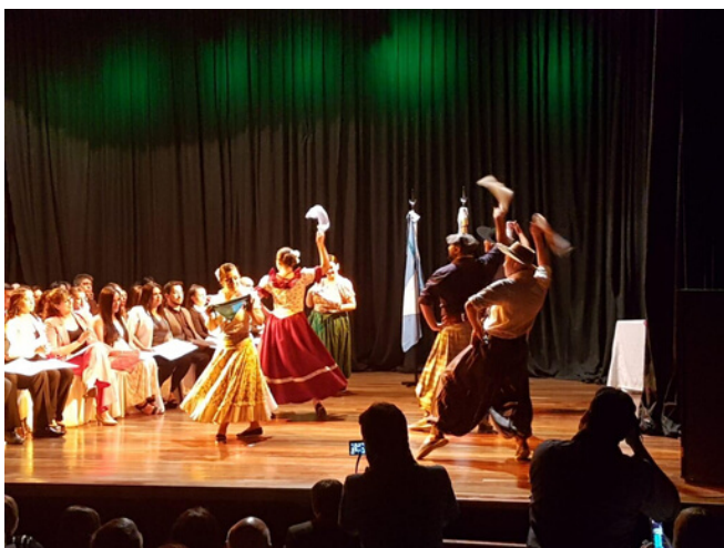
Actuando en un Acto de Colación de Grados