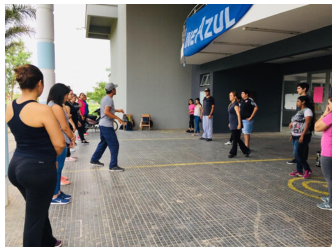
En pleno ensayo en la Facu de Humanidades